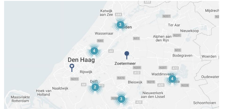
Schoolbesturen wel/niet aangesloten bij SO&P partnerschappen