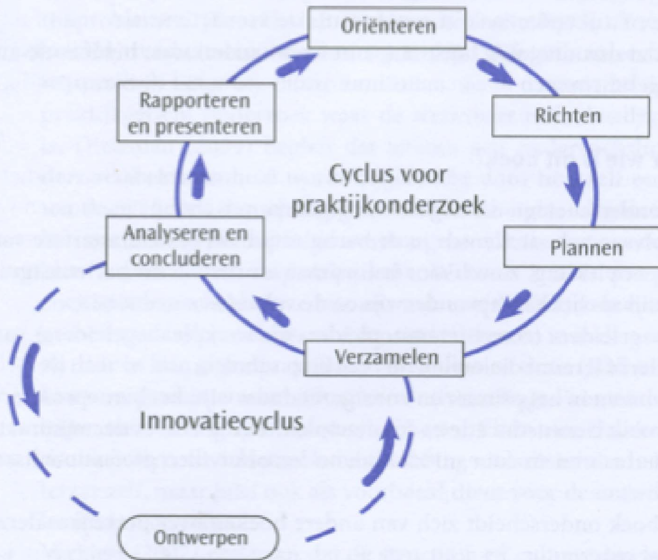
Figuur 1 ■ Kernactiviteiten voor praktijkonderzoek